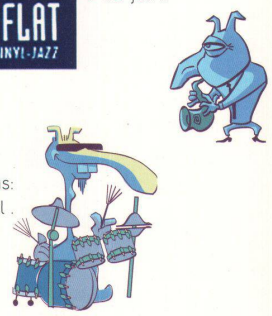
>... and on drums: Beat Kannel.